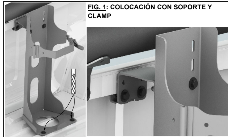
FIG. 1: COLOCACIÓN CON SOPORTE Y CLAMP